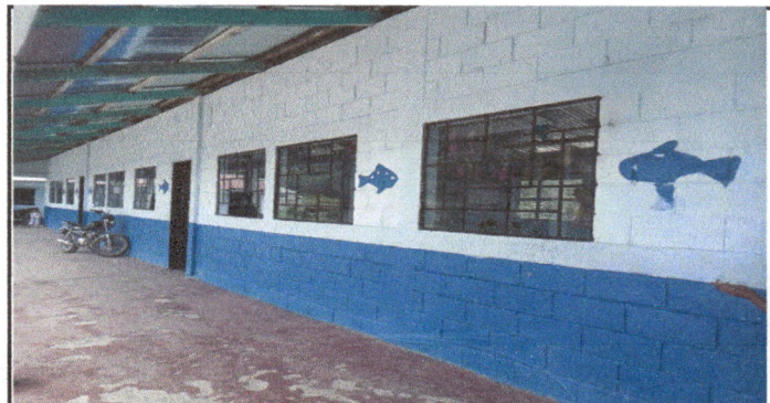
Foto 6: Fabricación e instalación de balcones de hierro en ventana. Módulo I

Observación: Si es necesario se pueden agregar hojas adicionales y actualizar el número de hojas.