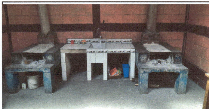
Foto 5: Sustitución de piso rústico por piso de granito y pintura en muros exteriores e interiores. Cocina