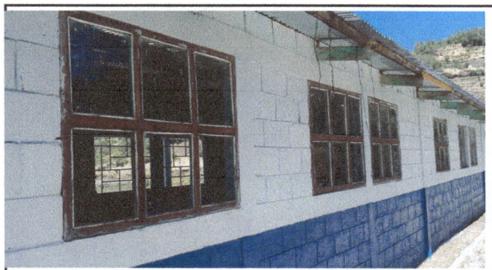
Foto 4: Sustitución de ventanas de madera por ventanas de metal mas vidrio en módulo I